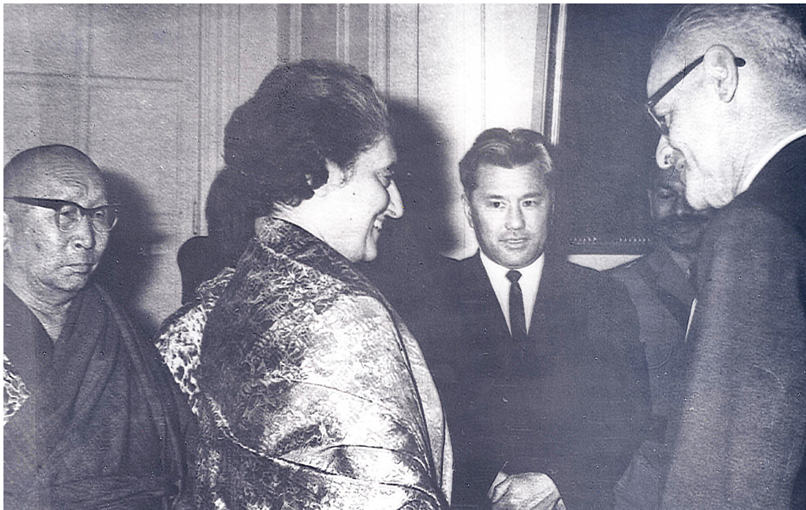
Пурбо Балданжапов с Индирой Ганди

и скрупулёзности исследования говорит тот факт, что этой работе предшествовал многолетний труд по переводу источника, составлению комментариев к тексту, критический анализ источника и его приложений [1; 2; 4].