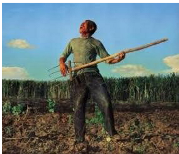
Рис. 1. Чжэн И. Плающее сердце пролетело (2003)

Так, философия Тайцзи является интеллектуальным кодом для разработки решения социально координированного управления значением в конкретных обстоятельствах, конфликтах и проблемах. Поэтому на основании принципов философии Тайцзи противоречивая проблема трудящихся-мигрантов Китая, остро актуальная для страны 1990-х гг., благодаря совместным усилиям государства, частного бизнеса, профсоюзов, партийных организаций на местах и отдельных лиц, превратилась в проблему адаптации и реформирования компетенций нового рабочего класса индустриального Китая. Человеческая природа по своей сути очень несовершенна, поэтому идеальное существование – это миф, недостижимый идеал. Философские принципы тайцзи направлены на поиск и обретение консенсуса и координации, что возможно при условии достижения приемлемых для его участников значений. Это возможно при условии коллективного управления значениями, когда происходит согласование коллективных и индивидуальных интерпретаций ценности консенсуса.