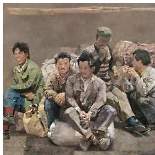
Рис. 2. Синь Дунван. Искренний город (1995)