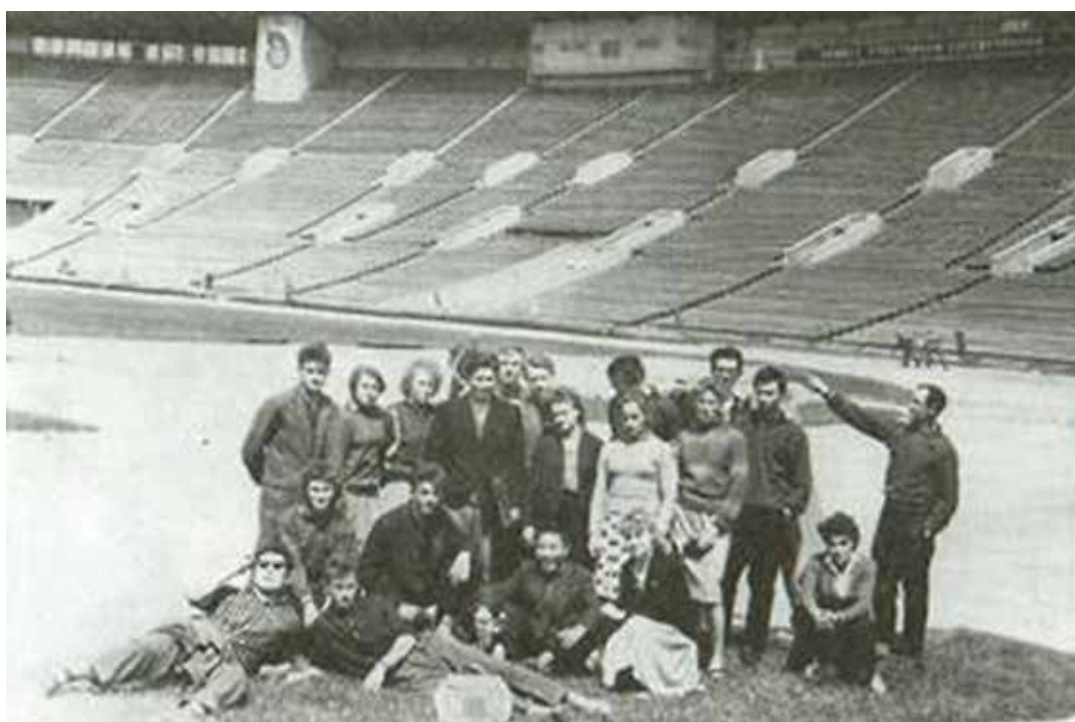
Рис. 2. Сборная Иркутской области на I Спартакиаде Народов СССР, Москва, центральный стадион «Лужники», 1956 г.