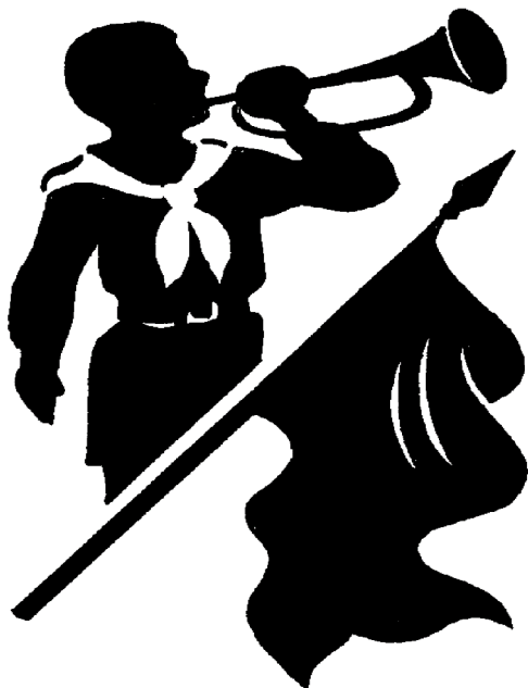
Рисунок Л. В. Болотова 1

Keywords: children's movement, children's organization, scout movement, pioneer organization, I. N. Zhukov